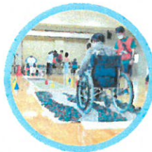
車いすアタックの関