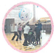
なかのと巾ボール